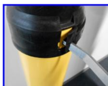
垂直にカバー穴へ